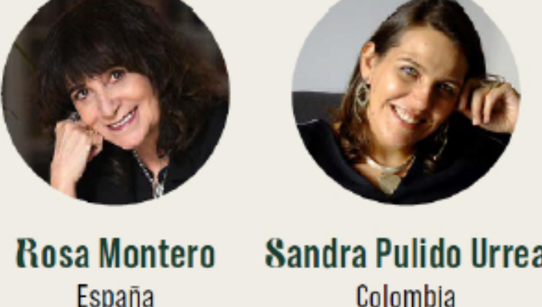
Rosa Montero España Sandra Pulido Urrea Colombia