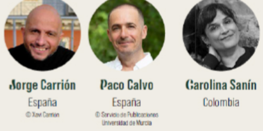
Jorge Carrión España © Xaer Caman Paco Calvo España © Corvato de Publicaciones Universidad de Murcia Carolina Sanín Colombia