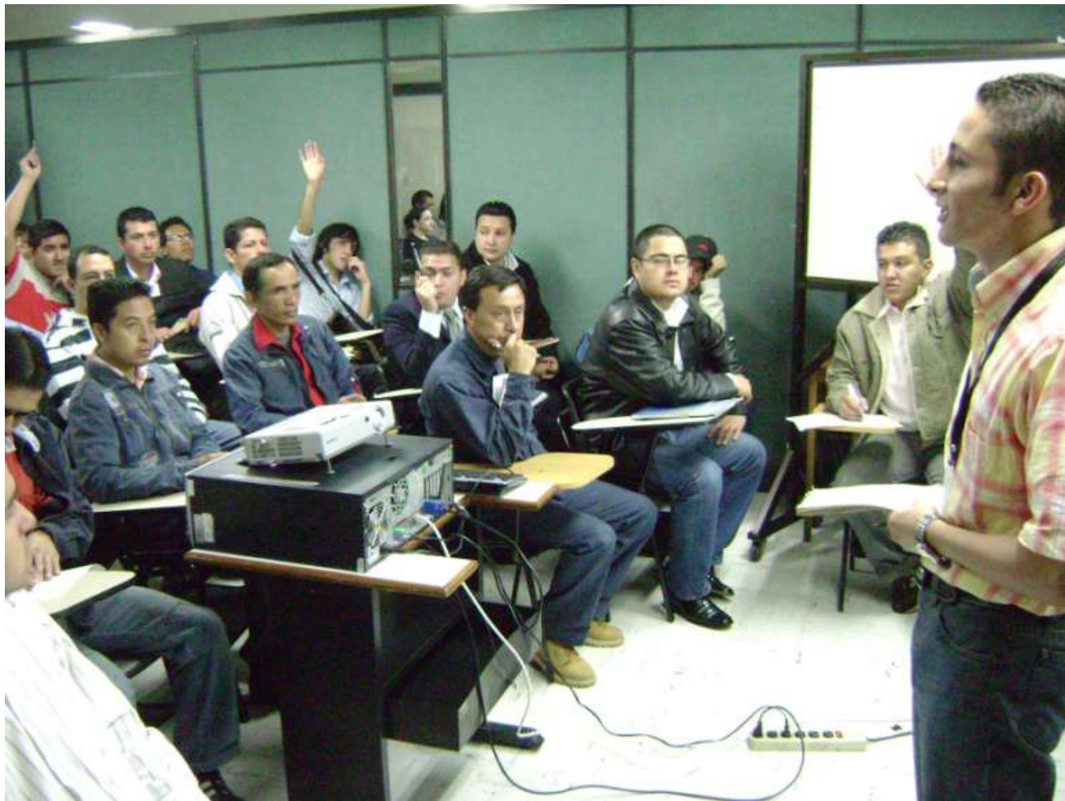
DIRECCION DE EMPLEO Y TRABAJO - SENA DIRECCION GENERAL