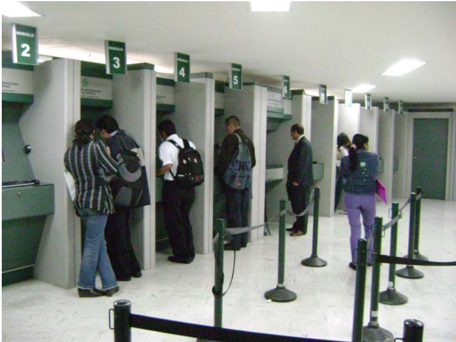
DIRECCION DE EMPLEO Y TRABAJO - SENA DIRECCION GENERAL