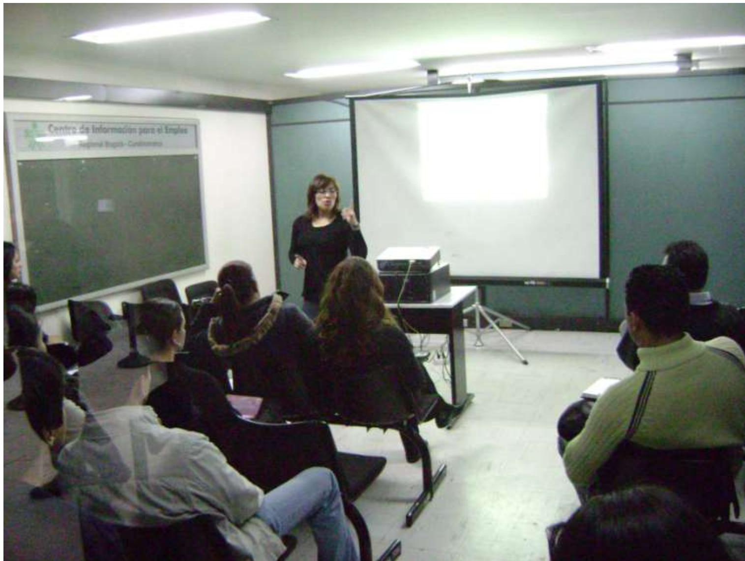
DIRECCION DE EMPLEO Y TRABAJO - SENA DIRECCION GENERAL