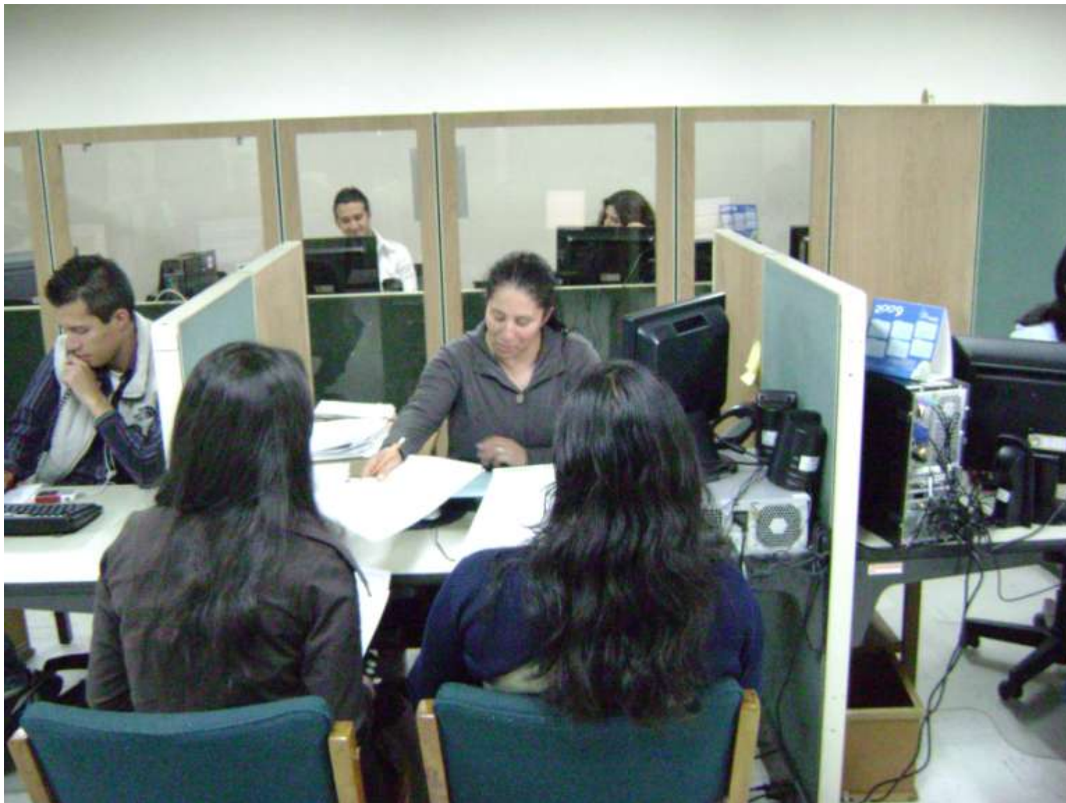
DIRECCION DE EMPLEO Y TRABAJO - SENA DIRECCION GENERAL