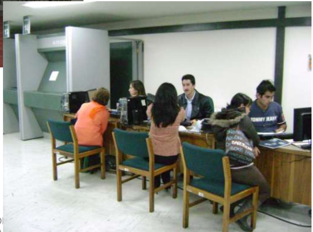
DIRECCION - SENA DIRECCION GENERAL